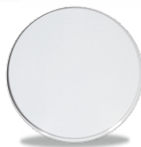
製造販売業者 アダマンド並木精密宝石株式会社